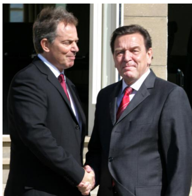
Tony Blair et Gerhard Schröder en 2005.

20-67 ans passera de 51,8 % à 47,3 % dans le meilleur des cas (44,8 % dans le pire). Il y aura donc à peine plus de deux actifs pour financer un retraité dans vingt ans.