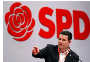
Le ministre fédéral allemand du travail, Hubertus Heil (SPD).

D'autant que derrière ces chiffres globaux, il y a deux particularités qui augmentent le risque de paupérisation de certaines catégories. D'abord, le fait que les travailleurs à faible qualification ont vu leur salaire et leur temps de travail les plus mis sous pression. Fragilisés par les lois Hartz IV, ce sont ces travailleurs des services à la personne notamment qui ont dû accepter le plus de sacrifices salariaux. Entre 2007 et 2018, les salaires réels des travailleurs non qualifiés ont progressé de 15 %, tandis que ceux des cadres ont augmenté de 21,3 %, soit 42 % de plus.