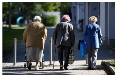
Des retraitées à Ingolstadt (Bavière), en octobre 2018.

la croissance moyenne des salaires. Mais on verra comment l'exemple allemand montre les limites de cette garantie.