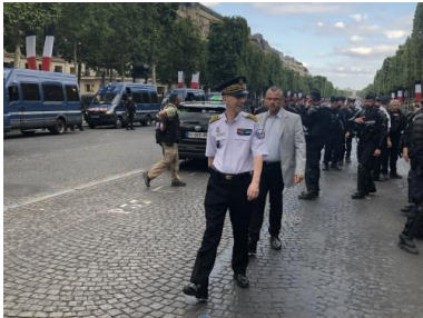
Le préfet de police de Paris, Didier Lallement, le 14 juillet 2019.

Finalement, pour « éviter un accident », le chef d'escadron désobéit aux ordres du préfet : il décide d'« escorter [les manifestants] jusqu'au métro ». Un choix dicté par le fait que « l'objectif tactique » initial avait « provoqué une dégradation de la situation », les manifestants « étant enfermés sans aucune issue ». De plus, « l'usage de gaz » avait eu l'effet « logique et prévisible de faire monter la tension alors même que le dialogue était établi. »