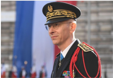
Didier Lallement a été nommé préfet de police de Paris le 20 mars 2019.

PAR PASCALE PASCARIELLO ARTICLE PUBLIÉ LE DIMANCHE 8 MARS 2020