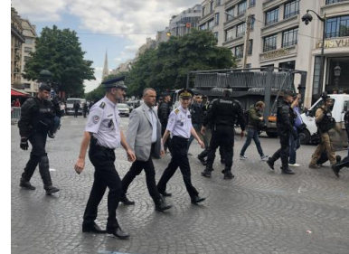
Le préfet de police de Paris, Didier Lallement, le 14 juillet 2019.

de réactivité, de contact, d'interpellations » tout « en assumant. En assumant, oui, les risques que cela comporte ».