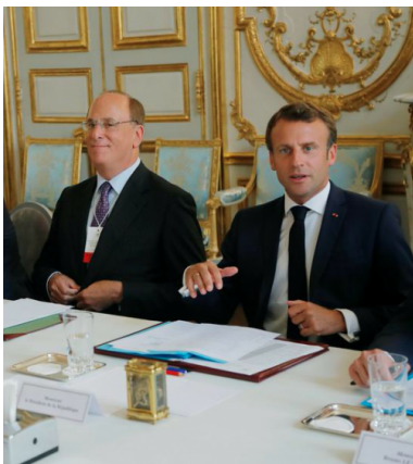
Larry Fink (BlackRock) et Emmanuel Macron à l'Élysée en juillet 2019

Premier gestionnaire d'actifs au monde, BlackRock a des vues sur l'épargne française, « une des plus élevées d'Europe ». À la faveur de la loi Pacte, première étape pour dynamiser la retraite par répartition, le fonds américain dispense ses recommandations au gouvernement.