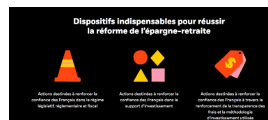
Les recommandations de BlackRock en images.

C'est cette gestion risquée de l'épargne que le gouvernement français accepte de soutenir dans sa promotion de la capitalisation. Officiellement, cela est censé aider le développement de l'épargne productive et le financement des PME. Mais les demandes de BlackRock au gouvernement vont tout à fait dans un sens opposé. Les produits d'épargne retraite, promus dans le cadre de la loi Pacte, doivent s'inscrire, recommande le gestionnaire, dans le cadre de la directive Juncker sur l'épargne paneuropéenne. Dans ce cadre, « la liste des investissements éligibles aux dispositifs d'épargne salariale gagnera à être étendue aux SICAV de droit étranger. [...] Un grand nombre de gestionnaires d'actifs ont des gammes de fonds domiciliées au Luxembourg ou en Irlande, qui sont aujourd'hui exclues de cette offre. » Intérêt : ces fonds sont non imposables. En d'autres termes, il faut faciliter l'évasion fiscale et la fuite des capitaux. Sans que cela fasse frémir un seul responsable.